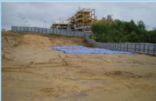
Cut & fill construction