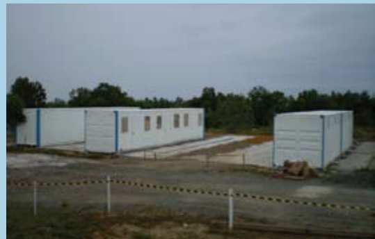
Container accommodation - site