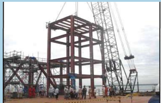
SCP pipe rack