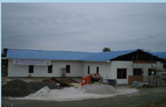
Site camp canteen