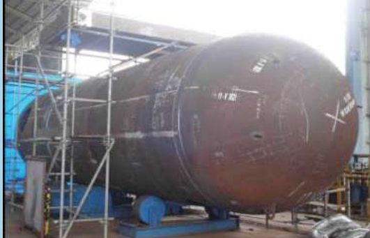
Vessel flare KO drum SCP & SMP