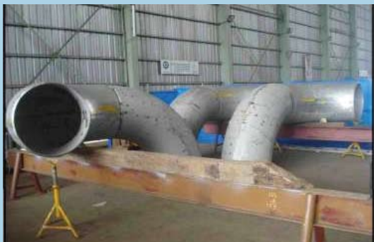
SMP piping spool stainless steel (large bore)