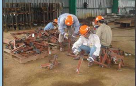
Fabrication of instrument support